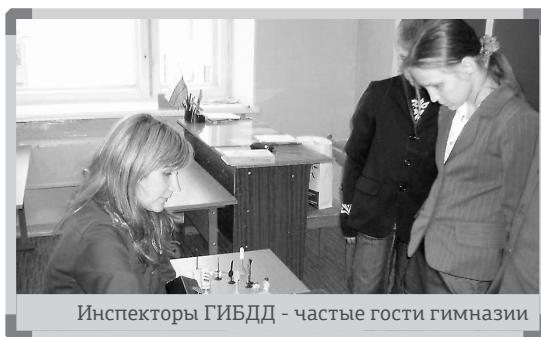
Инспекторы ГИБДД - частые гости гимназии

16 сентября в гостях у учеников гимназии №3 побывали представители общественного совета УВД, съёмочные группы телевизионных передач «708 на связи» и «Правопорядок».