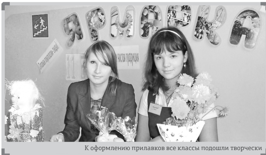
К оформлению прилавков все классы подошли творчески

Ученики гимназии подошли к проведению традиционной Малой Маргаритинской ярмарки очень ответственно. 8 сентября еще до начала первого урока школьные коридоры были заставлены столами, ломившимися от разнообразия продуктов. Ребята принесли на продажу овощи, фрукты, цветы, выращенные ими и их родителями на дачах. Работа шла очень бурно, каждый старался переманить покупателя к своему столику. Ученики предлагали разные акции, лотереи и конкурсы, ответишь правильно – получишь пятидесятипроцентную скидку. Вы, например, знаете, где впервые появи-