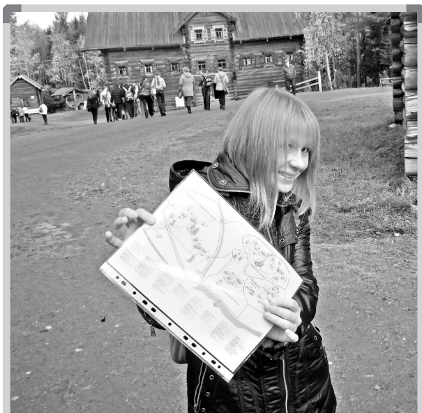
Каждый участник получил вот такую карту местности

19 сентября ученики тридцати школ города приняли участие в слете отрядов «Зеленый патруль» в Малых Карелах. Организатором мероприятия стали департамент образования мэрии города Архангельска и школа №59, музей деревянного зодчества и народного искусства «Малые Карелы»