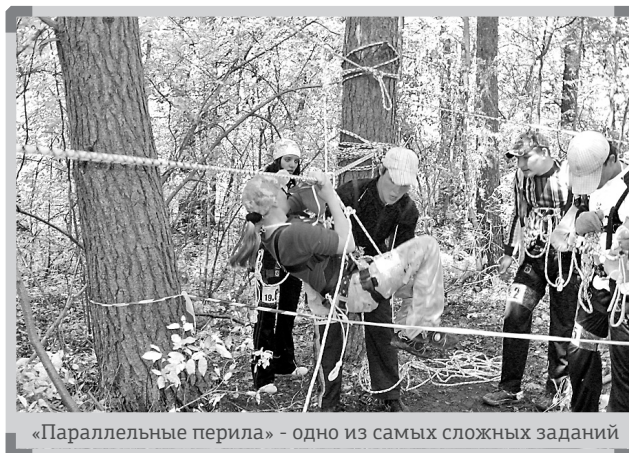
«Параллельные перила» - одно из самых сложных заданий

Во время соревнований команды проходили трассу, которую заранее подготовили старшеклассники. На каждом этапе маршрута ребятам предстояло пройти интеллектуальные, а порой даже экстремальные испытания. Например, с заданием «параллельные перила» сможет справиться далеко не каждый. Представьте, над землей параллельно друг другу на расстоянии двух метров натянута две веревки. Задача ребят – пройти по нижней, держась за верхнюю. Проверить собственную силу духа помогло еще одно испытание под названием «маятник». Участники